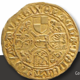
Goldgulden, 1470 – 1486

Nachdem die Burg in den letzten Tagen des Zweiten Weltkriegs niederbrannte, hat die Bayerische Schlösserverwaltung in den vergangenen Jahrzehnten zunächst den Burgfels und die Bausubstanz gesichert. Die Eröffnung des Museums im Jahr 2017 schloss den 2005 begonnenen Ausbau des Alten Schlosses zum Museum ab.